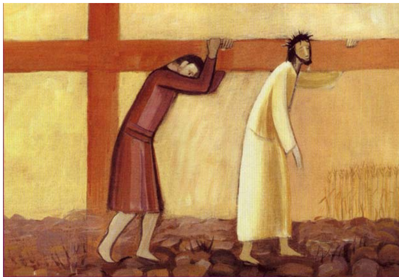
(R. Schmidt, RPP 1/1986)

Ježišu, i mne už veľa ľudí pomohlo niesť kríž, uľahčili mi život a vyriešili moje starosti a problémy.